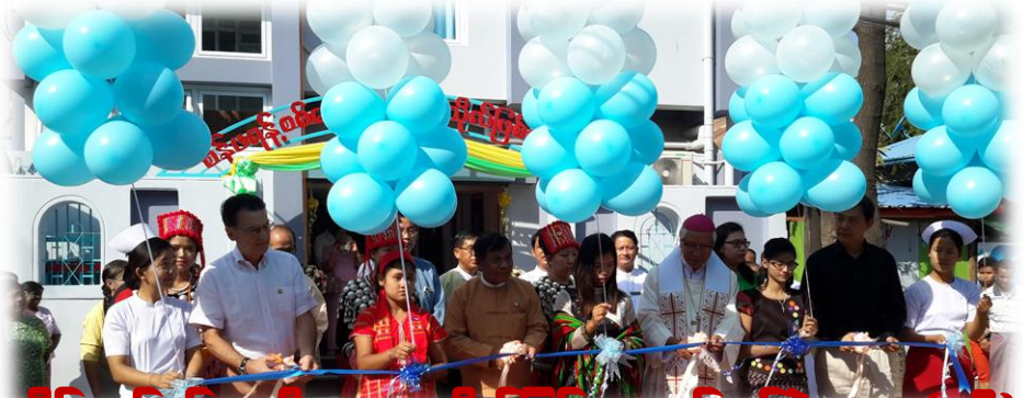
စိန်မရန်စစ်ရေးမီးယားကုသိုလ်ဖြစ်ဆေးခန်းဖွင့်ပွဲ....စာ(၁၆)