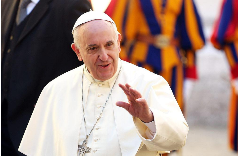
ဝါဒဖြန့်ခြင်း၊ သူ/သူမကိုယ်တိုင်အတွေ့အကြုံအသစ်ကလေးများရရှိခြင်း စသည်တို့ကြောင့်ဖြစ်နိုင်သည်။လွတ်လပ်သောပုဂ္ဂိုလ်

၎င်းထောင်ချောက်ထဲ၌ မျှော်ပါသောပုဂ္ဂိုလ်များသည် လွတ်လပ်မှုပျောက်ဆုံးသွားရုံမက ခေတ်သစ်ကျွန်လည်းဖြစ်သွားကြောင်း၊ မူးယစ်ဆေးဝါး သောက်သုံးကြရသည့် အကြောင်းရင်းကို ပြန်စဉ်းစားလျှင် များစွာသောအကြောင်းတရားများရှိကြောင်း၊ အချို့မှာမိသားစုဝင်မရှိခြင်း၊ လူမှုရေးဖိနှိပ်ချုပ်ချယ်မှုကြောင့် လူကုန်သူများမှ