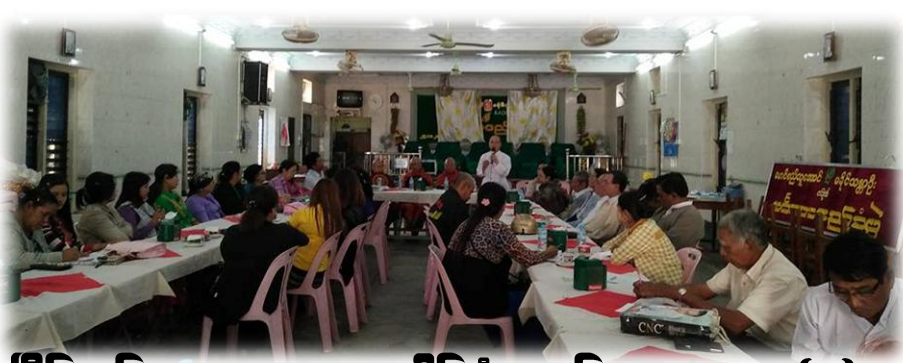
ငြိမ်းချမ်းမေတ္တာ ဘာသာပေါင်းစုံအစည်းအဝေး...စာ(၉)